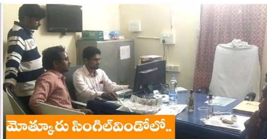
మోతూరు సింగిల్ విండోలో..

మోతూరు, అడ్డగూడూరు మండలాలకు చెందిన 254 మంది లబ్ధిదారుల ఖాతాల్లో ప్రభుత్వం రూ.3 లక్షల చొప్పున జమ చేసిందని, ఎన్నికల కోడ్ రావడంతో వాటిని డ్రా చేయకుండా అధికారులు ఫ్రీజింగ్లో పెట్టారని తెలిపారు. సుమారు రెండున్నరేళ్లపు తున్నా లబ్ధిదారులకు నిధులు విడుదల చేయడం లేదని, వెంటనే బ్యాంక్ ఖాతాలపై