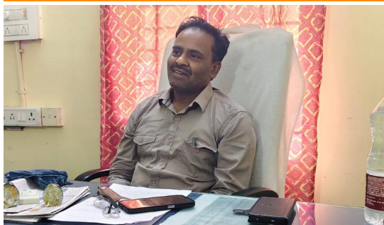
విలేకరులతో మాట్లాడుతున్న డీసీవో మురళీరమణ

విచారణకు ఆదేశించారు. యాదాద్రి కలెక్టర్ అనురాగ్ జయంతి కూడా ఉద్యోగులను