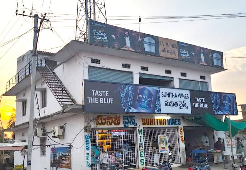
సంఘం భవనంలో నిర్వహిస్తున్న వైన్స్, సిటీంగ్ రూం (భవనం పైన సెల్ టవర్)

చేస్తున్నారు. సంఘానికి మోతూరు మున్సిపాలిటీలో రూ.కోట్ల విలువ చేసే ఆస్తులు ఉన్నాయి. భవనగిరి మెయిన్ రోడ్డులో అర ఎకరం స్థలంలో మినీ ఫంక్షన్ హాల్, 8 షట్టర్లు, చెరువు కట్ట చౌరస్తా వద్ద ఓ పెద్ద భవనం ఉంది. మినీ ఫంక్షన్ హాల్ ను ఓ వ్యక్తికి లీజుకు ఇవ్వగా, మెయిన్ రోడ్డు వెంట ఉన్న 8 షట్టర్లను కిరాయిలకు ఇచ్చారు. చెరువు కట్ట వద్ద భవనాన్ని వైన్ షాపు, సిటీంగ్ రూంకు అద్దెకు ఇచ్చారు. భవనంపైన కొన్నేండ్ల కిందట ఓ సెల్ కంపెనీ టవర్ ఏర్పాటు చేసింది. వీటన్నింటి నుంచి కిరాయిల రూపంలో నెలకు రూ.లక్షల్లో ఆదాయం వస్తున్నా ఆ లావాదేవీలన్నీ బ్రహ్మారహస్యమేనని చేనేత నాయకులు ఆరోపిస్తున్నారు. దేని నుంచి నెలకు ఎంత కిరాయి వస్తుంది..అడ్వాన్స్ ఎంత ఇచ్చింది మేనేజర్ నర్రయ్యకు తప్ప ఏ కార్మికునికి తెలియదంటున్నారు. అడిగినా నీకేం అవసరమంటూ చెప్పరు. వాస్తవంగా వస్తుంది ఎంత..సంఘంలో జమ చేస్తుంది ఎంత అన్నది ఏ దేవునికే ఎరుక అని కార్మికులంటున్నారు. సంఘం మినీ ఫంక్షన్ హాల్ ను గతంలో ఏడాదికి రూ.3 లక్షలకు పైగా లీజుకు ఇవ్వగా, కార్మికుల సమక్షంలో