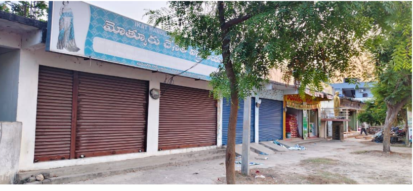
కిరాయిలకు ఇచ్చిన సంఘం షట్టర్లు